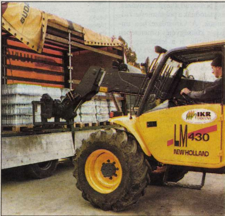
Egy kamionnyi ásványvizet indított útjára a Mohai Ágnes Ásványvízki-termelő Kft., hogy segítsen a kárpátaljaiaknak