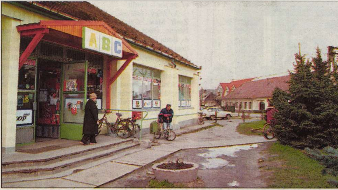
A ma még rendezetlen főtérre pad és ivókút várja majd az árnyas fák alatt pihenni vágyókat

Adony (DH) – Pihenőpark várja hamarosan a falubelieket és a kirándulókat a falu központjában. A község-házától az élelmiszerboltig terjedő rész átalakításával zárul a millenniumi program-sorozat.